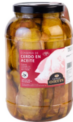
Lomo de Cerdo en Conserva (1 y 4 kg)