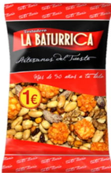
Cóctel Montañés (1€)