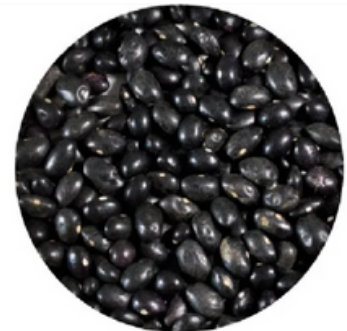
Alubia Negra Maragato (10 kg)