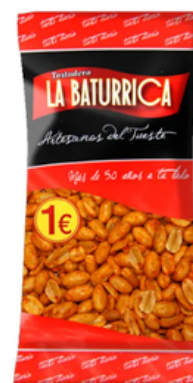
Cacahuete Frito Picante (1€)