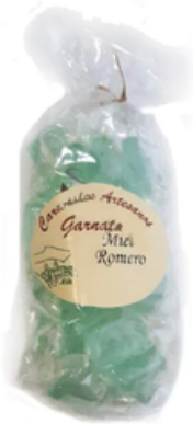
Garnata Sabor Miel y Romero (145 gr)