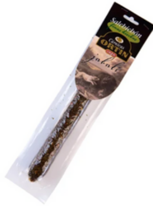
Salchichón de Jabalí a las Finas Hierbas