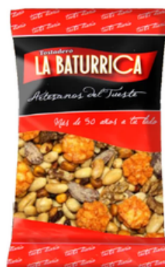
Cóctel Montañés (1 kg)