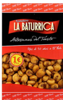
Maíz Gigante Barbacoa (1€)