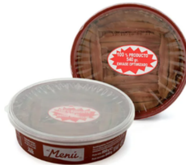
Anchoa en Salmuera El Menú (540 gr)