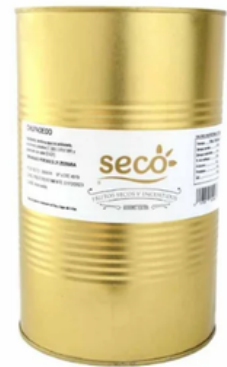
Aceitunas Chupadedos Gordal (2,5 kg)