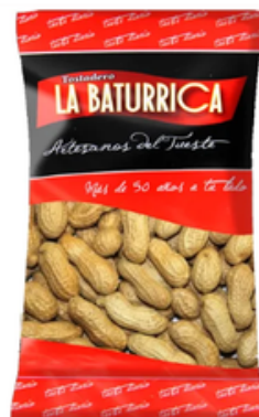
Cacahuete con Cáscara sin Sal (3 kg)