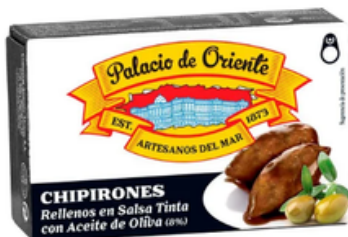
Chipirón en su Tinta Conservas Antonio Alonso (111 gr)