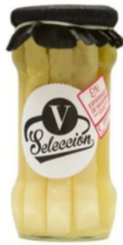
Espárragos en Conserva D.O. Navarra Selección V (500 g)