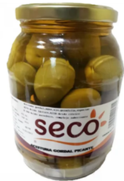
Barrilito de Aceitunas Pica Pica (550 gr)