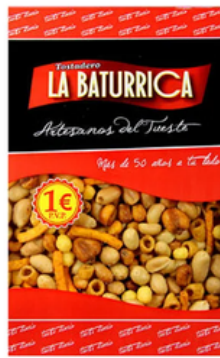
Cóctel Celebrity (1€)