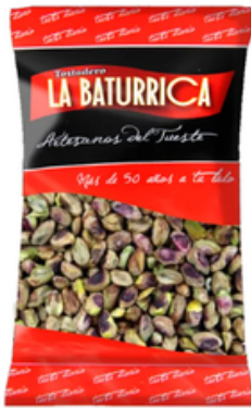
Pistacho Mondado Crudo (1 kg)