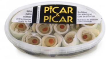
Rollitos de Arenque Picar y Picar (220 y 700 gr)