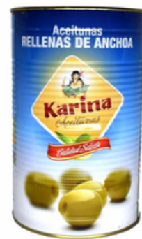
Lata de Aceitunas Rellenas de Anchoa (600 gr)