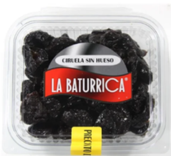
Ciruela Desecada sin Hueso (1 kg)