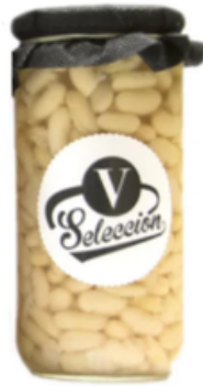
Alubias en Conserva Selección V (500 g)