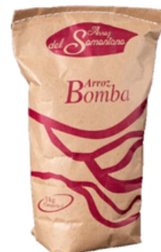
Arroz del Somontano Bomba (1 y 5 kg)