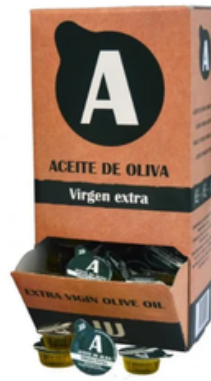
Monodosis de Aceite de Oliva Virgen Extra (160 uds)