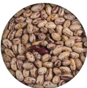
Alubia Pinta Maragato (10 kg)