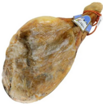
Jamón de Cerda