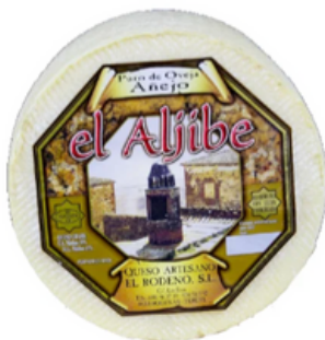
Queso de Oveja Añejo (900 gr)