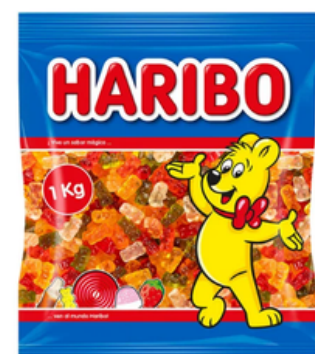
Ositos de Gominola Haribo (1 kg)