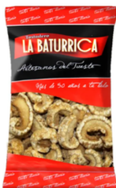
Torrezno Ibérico Sabor Barbacoa (1 kg)