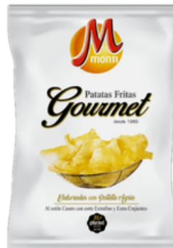
Patatas Fritas Gourmet Sabor Jamón Monti (130 gr)