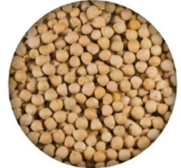
Garbanzo Pedrosillano Maragato (10 kg)