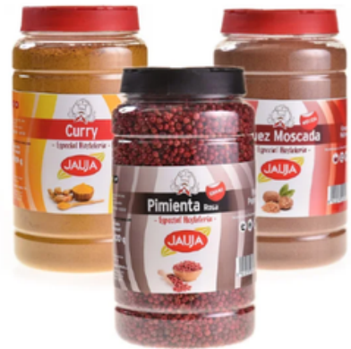
Selección de Especies y Sazonadores Jauja (1 kg)