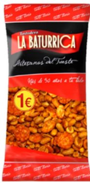
Cóctel Picante (1€)