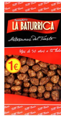
Cacahuete Garrapiñado (1€)