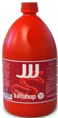
Ketchup (2 kg)