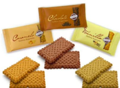
Caja 200 Galletas Speculoos Surtido 3 Sabores