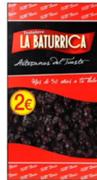
Arándano Rojo (2€)