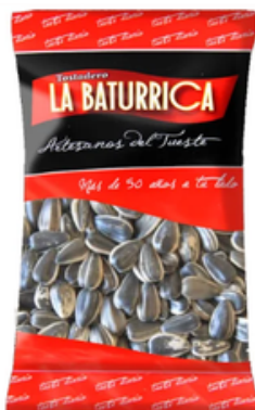
Pipa de Girasol Sin Sal (3 kg)