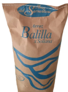
Arroz del Somontano Balilla (1 kg)