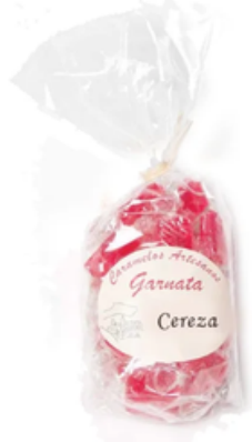
Garnata Sabor Cereza (145 gr)