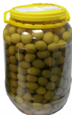
Garrafa de Aceitunas Sabor Anchoa (4,2 L)