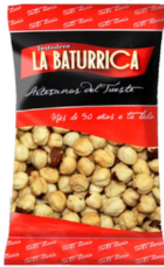
Avellana Repelada Tostada (1 kg)