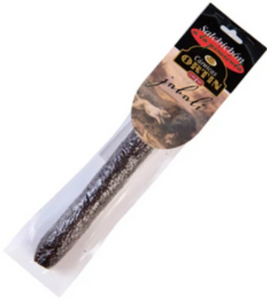
Salchichón de Jabalí a la Pimienta