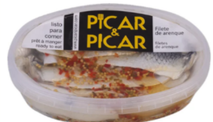
Arenque Picar y Picar (220 gr)