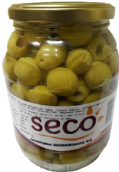
Barrilito de Aceitunas Deshuesadas (550 gr)