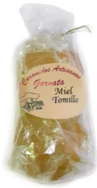
Garnata Sabor Miel y Tomillo (145 gr)