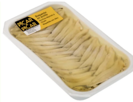
Boquerón en Aceite Picar y Picar (200 gr)