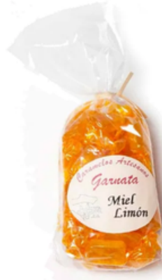
Garnata Sabor Miel y Limón (145 gr)