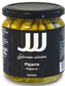
Piparras Extra JJJ (370 gr)