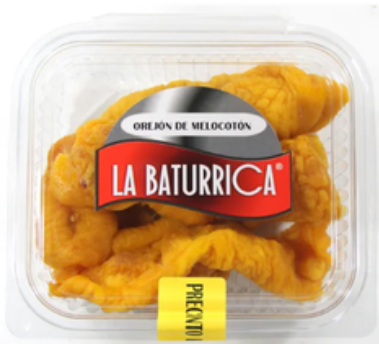
Orejón de Melocotón (1 kg)