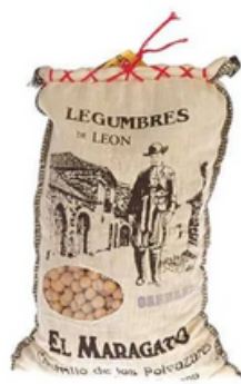
Garbanzo Lechoso Maragato GOURMET (1 kg)