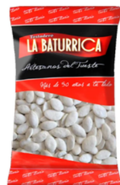
Pipa de Calabaza con Sal (3 kg)