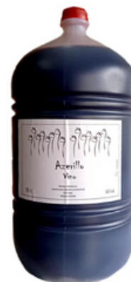
Vino Garnacha Azerillo Bidón (5 L)