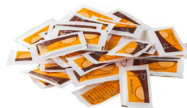
Caja 250 Sobres de Sacarina (7-8 gr)