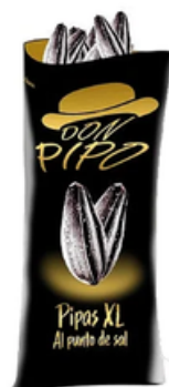
Pipas XL Don Pipo Al Punto de Sal (170 gr)