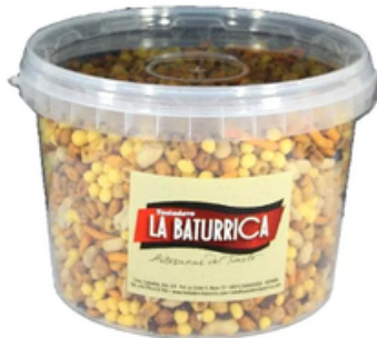
Cubo de Cóctel Tentempié (4600 mL)