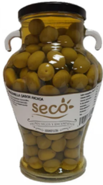
Jarra de Aceitunas Manzanilla (1,48L)