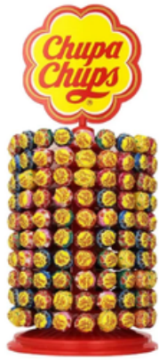
Expositor de Chupa-Chups (200 un)