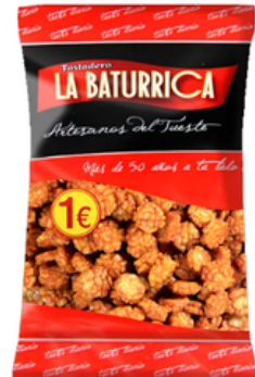
Aperitivo Mexicano Picante (1€)