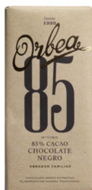
Chocolate Negro Orbea 80% (125 gr)