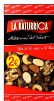
Cóctel Natural (2€)