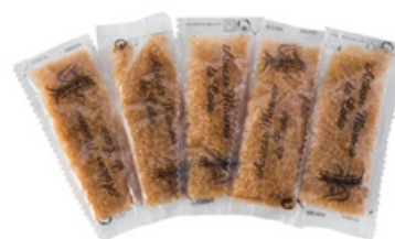
Caja 500 Sobres de Azúcar Moreno (7-8 gr)