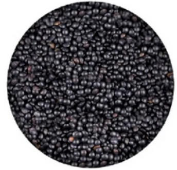
Lenteja Caviar Maragato (10 kg)