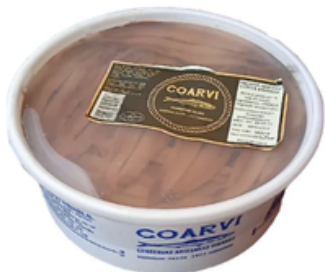
Anchoa Abierta Costa Vinaros (525 gr)