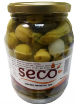
Barrilito de Cóctel Vegetal (550 gr)