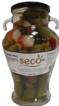
Jarra de Banderillas Picantes (1,48L)