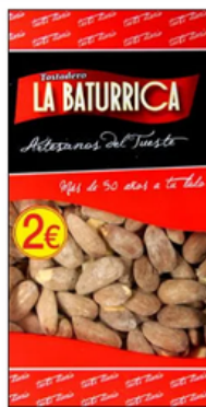
Almendra Salada (2€)