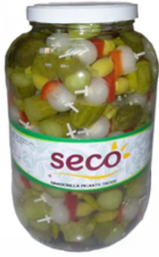
Galón de Banderillas Picantes (3,7 L)