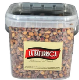
Cubo de Cóctel Montañés (3700 mL)