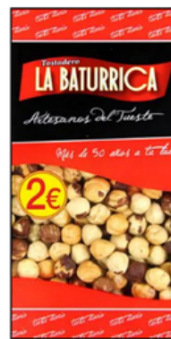
Avellana Tostada (2€)