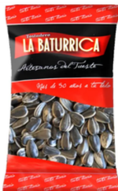
Pipa de Girasol con Sal (3 kg)