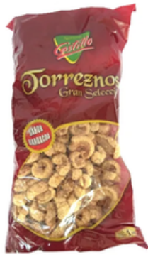
Torreznos Barbaoca Castillo (1 kg)