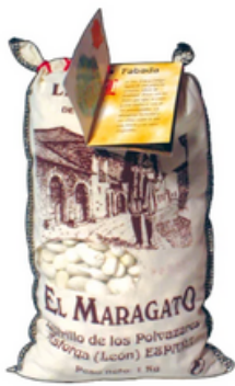
Alubia Riñón Maragato GOURMET (1 kg)