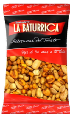
Cóctel Tentempié (1 kg)