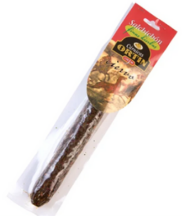
Salchichón de Ciervo a las Finas Hierbas