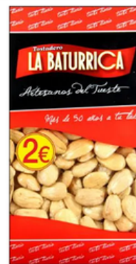
Almendra Frita (2€)