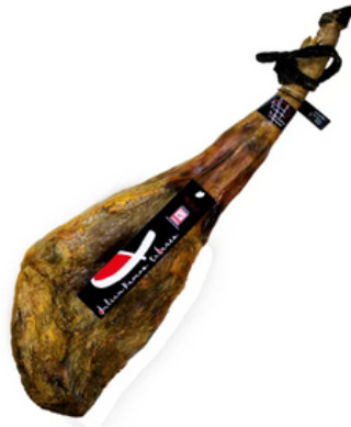
Jamón Ibérico 100% Bellota Ramos Tabares