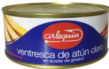
Ventresca de Atún Claro en Aceite de Girasol Arlequín (900 gr)