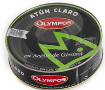
Atún Claro Olympos (RO-1800)