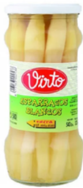
Espárragos de Importación en Conserva Selección V (500 g)