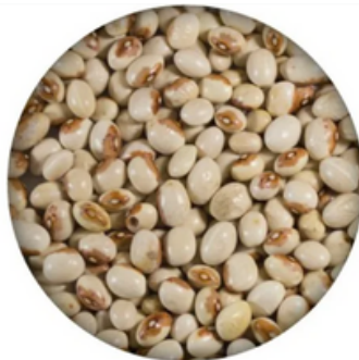
Alubia del Pilar Maragato (10 kg)