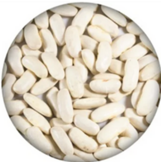
Fabes Asturianas Maragato (5 kg)