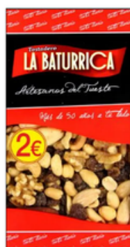
Cóctel Lujo (2€)