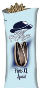
Pipas XL Don Pipo Aguasal (170 gr)