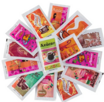
Caja 1000 Sobres de Azúcar Blanco (7-8 gr)