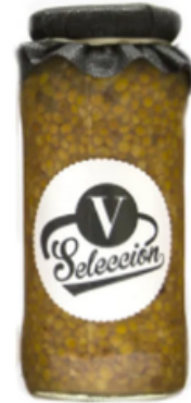
Lentejas en Conserva Selección V (500 g)