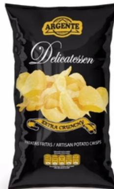
Patatas Fritas Argente Delicatessen (40 y 180 gr)