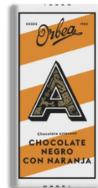
Chocolate Negro Orbea con Naranja (125 gr)