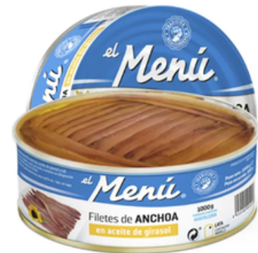
Anchoa en Aceite El Menú (RO/1000 gr)