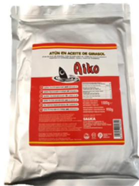
Atún en Aceite de Girasol Aiko (1 kg)