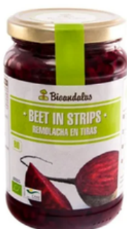
Remolacha Rallada Selección V (3 kg)