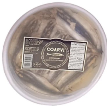
Boquerón Palometa Coarvi (850 gr)