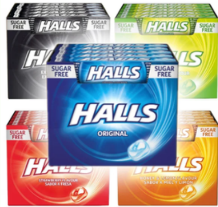
Caramelos Halls de Sabores (20 un)