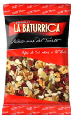
Cóctel Premium Ensaladas (1 kg)