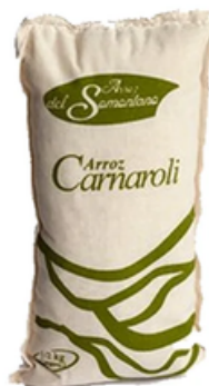
Arroz del Somontano Carnaroli (1 y 5 kg)