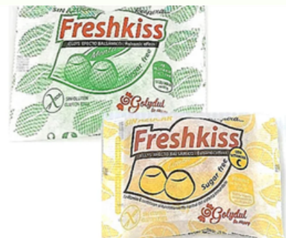
Gominolas Balsámicas Freshkiss Menta y Limón (25 gr)