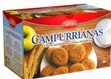
Caja Galletas Campurrianas Cuétara (800 gr)