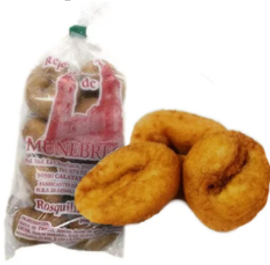
Rosquillas Fritas de Munébrega (200 gr)