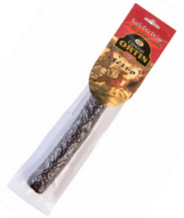
Salchichón de Ciervo a la Pimienta