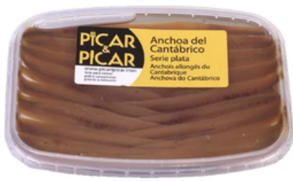
Anchoa del Cantábrico Picar y Picar (120 gr)