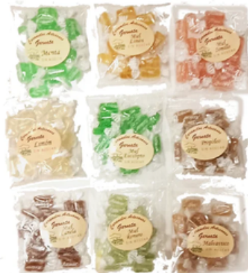
Garnata Sin Azúcar Varios Sabores (80 gr)