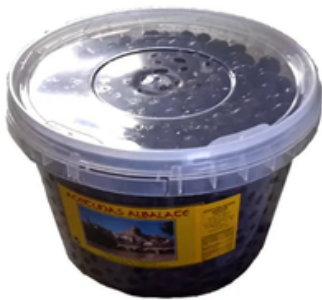
Cubo de Aceitunas Negras Albalate (5 kg)