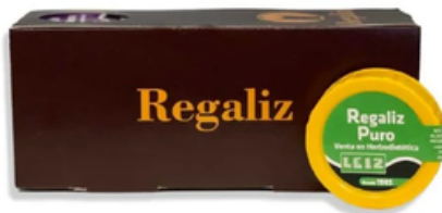
Pastillas de Regaliz Puro (12 x 10 gr)