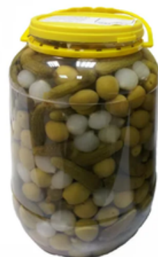
Garrafa de Cóctel Vegetal (4,2 L)