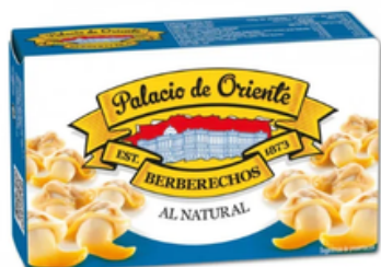
Berberecho Conservas Antonio Alonso (115 gr)