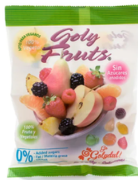
Gominolas Naturales Golydul Goly Fruits (70 gr)