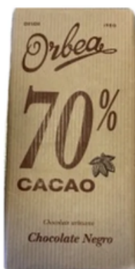
Chocolate Negro Orbea 70% (125 gr)