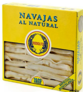
Navajas 16/20 Rodolfo (520 gr)