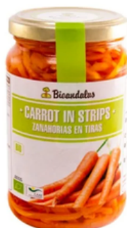
Zanahoria Rallada Selección V (3 kg)