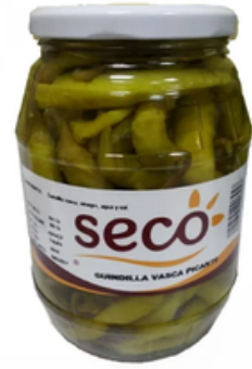
Barrilito de Guindillas (390 gr)