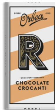
Chocolate Crocanti Orbea (125 gr)