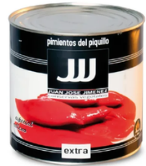
Pimientos del Piquillo Extra JJJ 80/100 (3 kg)