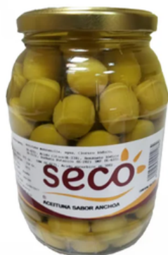
Barrilito de Aceitunas con Hueso Sabor Anchoa (550 gr)