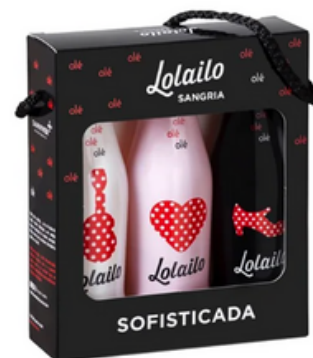
Lolailo Sangría Sofisticada Estuche de 3 Botellas (20 cl)