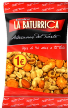
Cóctel Balear (1€)