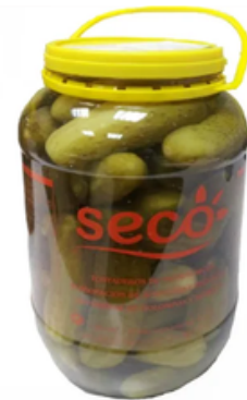
Garrafa de Pepinos 10/20 (4,2 L)