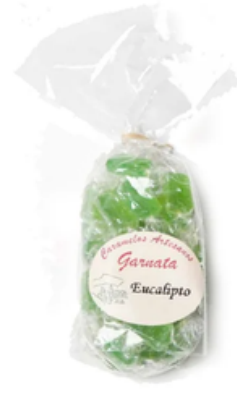
Garnata Sabor Eucalipto (145 gr)