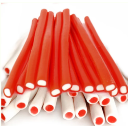
Regalices Clásicos Rellenos Fresa-Nata y Nata-Fresa