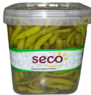
Cubo de Guindillas (4,5 L)