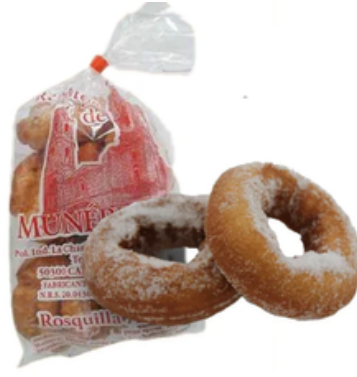
Rosquillas de Azúcar de Munébrega (240 gr)