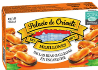
Mejillón 13/18 Conservas Antonio Alonso (115 gr)