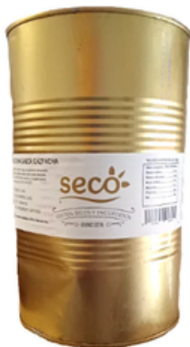
Lata de Aceitunas Gazpachada (5 kg)