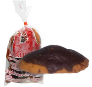
Magdalenas de Chocolate de Munébrega (400 gr)