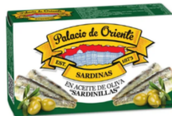
Sardinilla en Aceite de Oliva Conservas Antonio Alonso (81 gr)