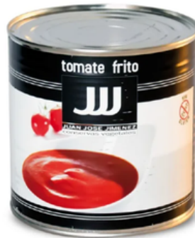
Tomate Frito JJJ (3 kg)