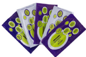
Caja 500 Sobres de Azúcar Blanco con Agitador (7-8 gr)