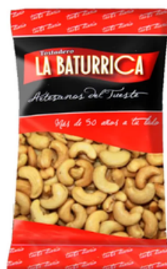
Anacardo Frito (1 kg)