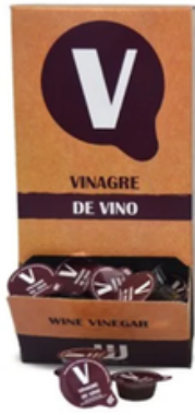
Monodosis de Vinagre (160 uds)