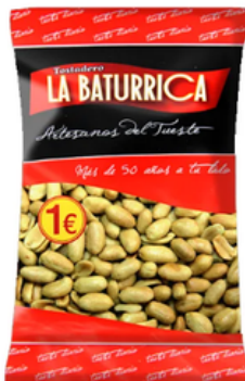
Cacahuete Frito (1€)