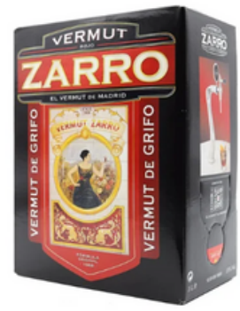
Vermut Zarro Bib (3 L)