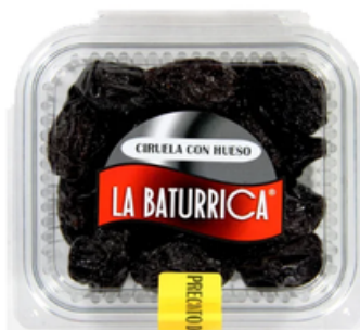
Ciruela Desecada con Hueso (1 kg)