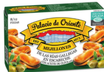
Mejillón 8/12 Conservas Antonio Alonso (115 gr)