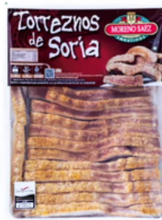
Torreznos Prefritos Moreno Saez (20 un)