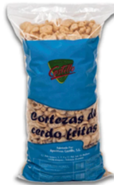
Cortezas de Cerdo Fritas Castillo (1 kg)