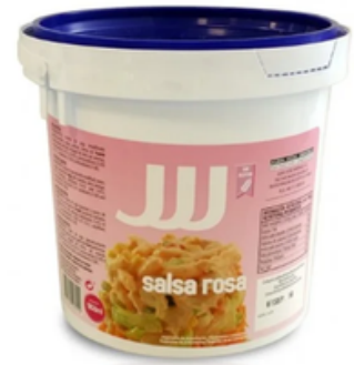
Salsa Rosa (2 kg)