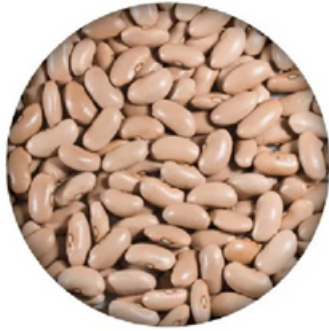
Alubia Canela Maragato (10 kg)