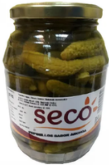
Barrilito de Pepinillos (550 gr)