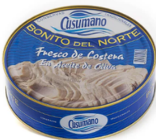
Pandereta de Bonito del Norte Cusumano (1800 gr)