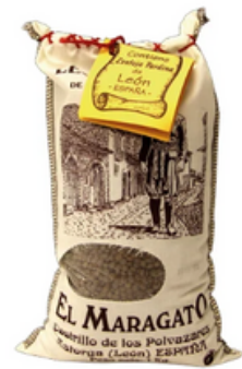
Lenteja Pardina Maragato GOURMET (1 kg)