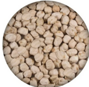
Garbanzo Lechoso Maragato (10 kg)