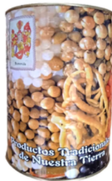
Lata de Aceitunas Aliñadas Machacabu (5 kg)