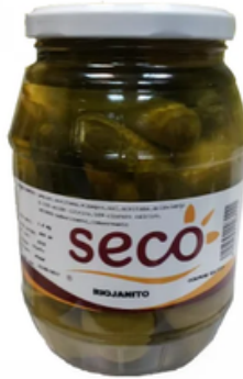
Barrilito de Riojanitos (400 gr)