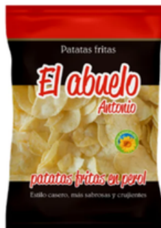
Patatas Fritas Artesanas El Abuelo Antonio (150 gr)