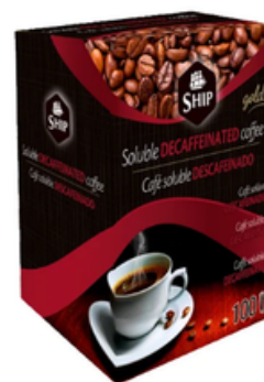
Caja 100 Sobres de Café Descafeinado Ship