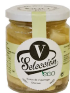
Yemas de Espárrago D.O. Navarra Selección V (250 g)