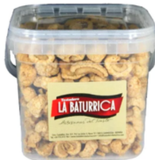
Cubo de Torrezno Ibérico (3700 mL)