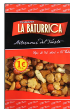
Cóctel Japonés (1€)