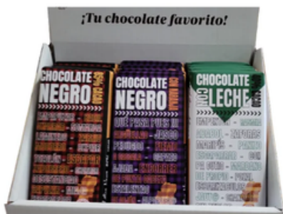
Surtido de Tabletas de Chocolate Artesano Aragonés (36 uds)