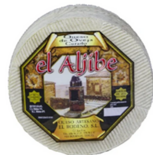
Queso de Oveja Curado (900 gr)