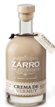
Crema de Vermut Zarro Botella (70 cl)