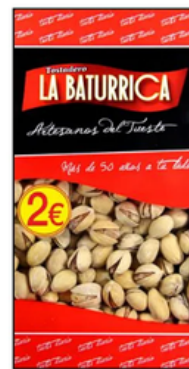
Pistacho Tostado (2€)