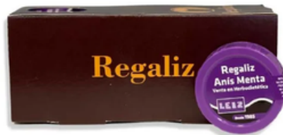
Pastillas de Regaliz con Menta y Anís (12 x 10 gr)