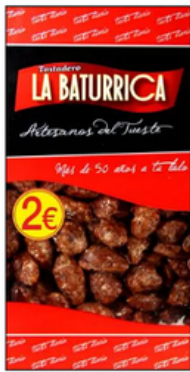
Almendra Garrapiñada (2€)