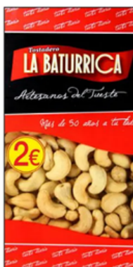
Anacardo Frito (2€)