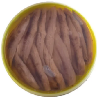
Lomo de Arenque (24/26 un)