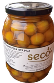
Barrilito de Aceitunas Aliñadas Pica Pica (550 gr)