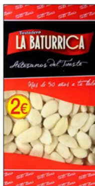
Almendra Repelada Cruda (2€)