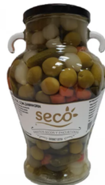
Jarra de Cóctel Vegetal (1,48L)