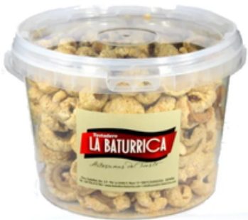
Cubo de Torrezno Ibérico (4600 mL)