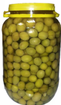
Garrafa de Aceitunas Sin Hueso (4,2 L)