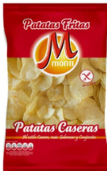
Patatas Fritas Caseras Monti (1 kg)