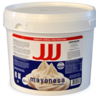
Mayonesa (3600 mL)