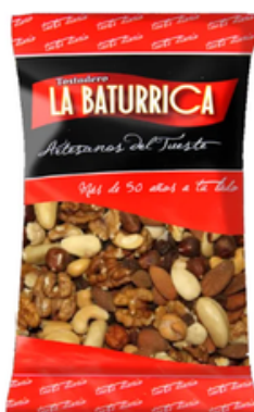
Cóctel Natural (1 kg)