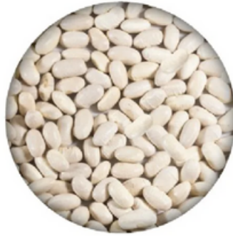
Alubia Riñón Maragato (1 y 10 kg)