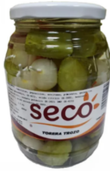
Barrilito de Banderillas Toreras (400 gr)