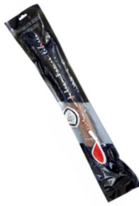
Salchichón de Bellota Ramos Tabares