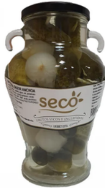
Jarra de Navarras (1,48L)