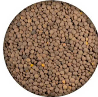
Lenteja Pardina Maragato (1 y 10 kg)