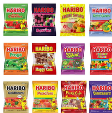
Surtido Variado de Gominolas Haribo (100 gr y 1 kg)