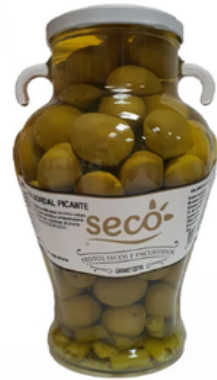
Jarra de Aceitunas (1,48L)