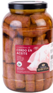
Longaniza de Cerdo en Conserva (1 y 4 kg)