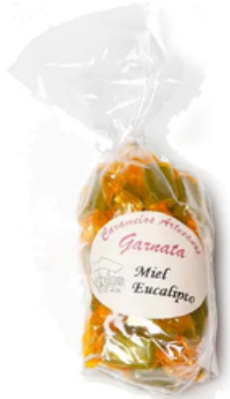
Garnata Sabor Miel y Eucalipto (145 gr)