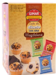
Mini Magdalenas de Chocolate (1,5 kg)