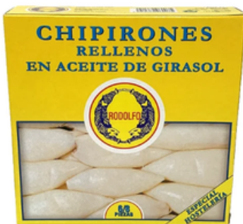
Chipirón Relleno 6/8 Rodolfo (RO-550)