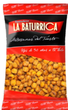
Maíz Crujiente Barbacoa (1 kg)