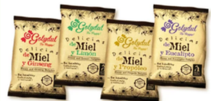
Gominolas Naturales Golydul Delicias de Miel y Varios Sabores (100 gr)