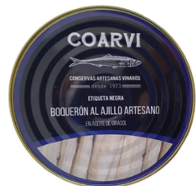
Boquerón en Vinagre Coarvi (RO/1000 gr)