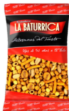
Cóctel Celebrity (1 kg)