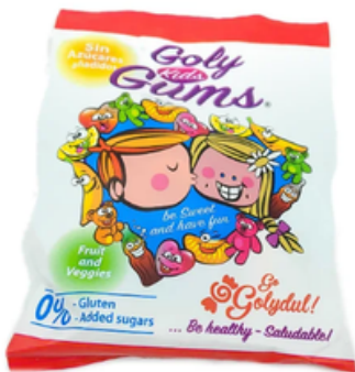
Gominolas Naturales Golydul Goly Gums Kids (70 gr)