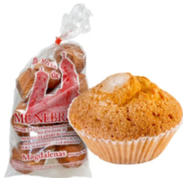
Magdalenas de Munébrega (400 gr)