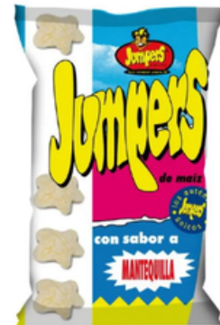
Snack Jumpers Sabor Mantequilla (42 y 100 gr)