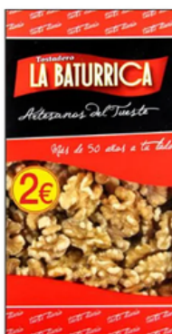
Nuez Mondada (2€)