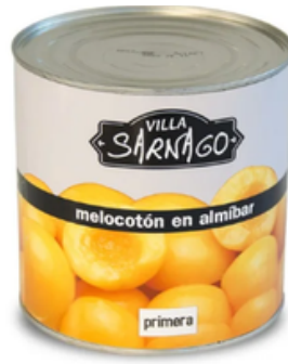
Melocotón en Almíbar Villa Sarnago (3 kg)