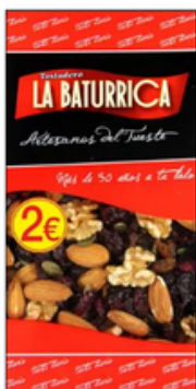
Cóctel Excellent Nuts (2€)