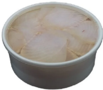
Tarrina de Bacalao Ahumado en Aceite (750 gr)