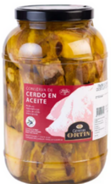
Costilla de Cerdo en Conserva (1 y 4 kg)