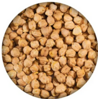
Garbanzo Manteca Maragato (1 y 10 kg)