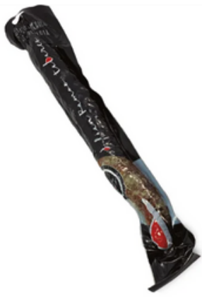
Chorizo de Bellota Ramos Tabares