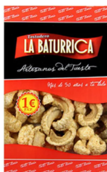
Torrezno Ibérico (1€)