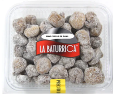
Higos Secos (1 kg)