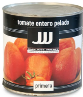
Tomate Natural JJJ (3 kg)