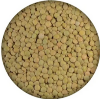
Lenteja Castellana Maragato (10 kg)