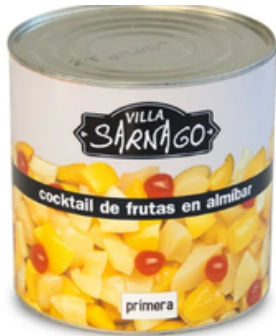
Cocktail de Frutas en Almíbar Villa Sarnago (3 kg)