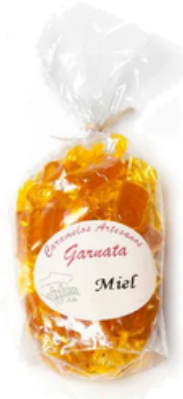
Garnata Sabor Miel (145 gr)