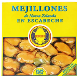
Mejillón en Escabeche 20/25 Rodolfo (RO-550)