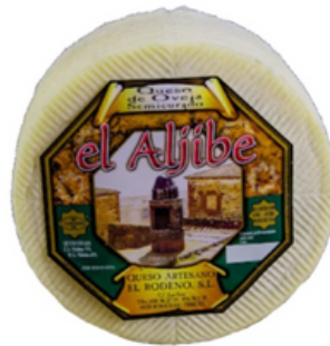
Queso de Oveja Semicurado (900 gr)