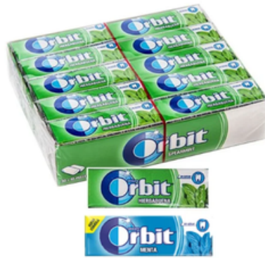
Chicles Orbit de Menta y Hierbabuena (30 un)