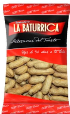
Cacahuete con Cáscara con Sal (3 kg)