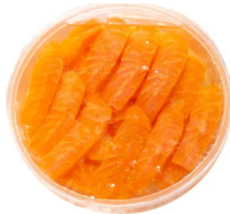
Tarrina de Salmón Fresco (750 gr)