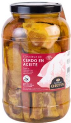
Mezcla de Cerdo en Conserva (1 y 4 kg)