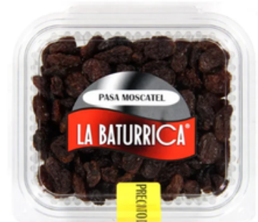
Pasa Moscatel de Málaga (1 kg)