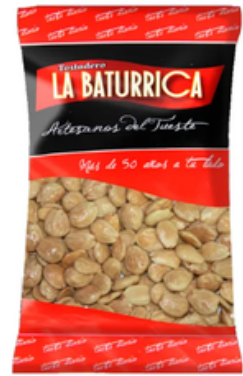
Almendra Marcona Frita (1 kg)