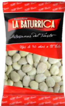
Almendra Marcona Cruda (1 kg)