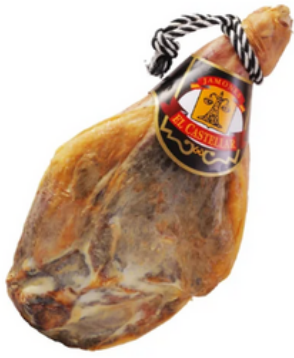
Jamón de Teruel Jaelca