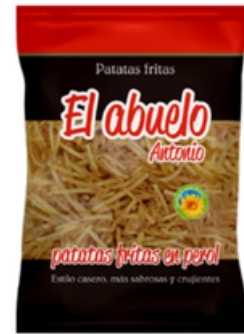
Patatas Paja Artesanas El Abuelo Antonio (100 gr)