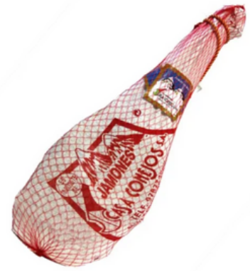
Maza de Jamón de Teruel